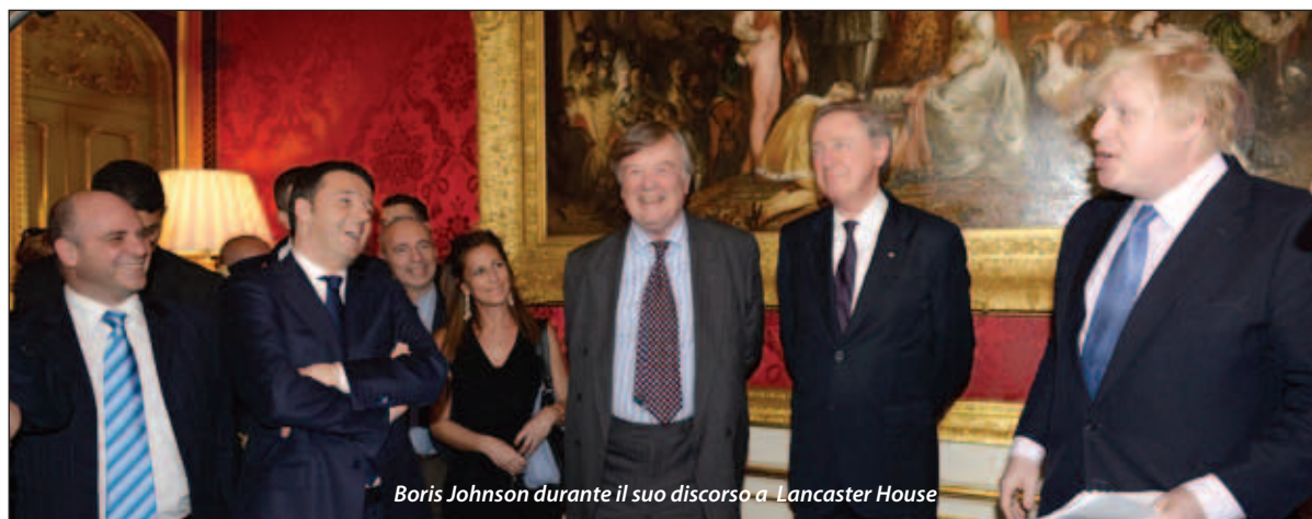
Boris Johnson durante il suo discorso a Lancaster House